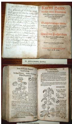
Knjiga Quintua Apollinariusa

Najstarija knjige medicinskog sadržaja, nastale u 16. stoljeću su: