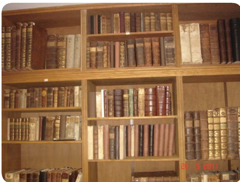
Knjige u današnjoj knjižnici