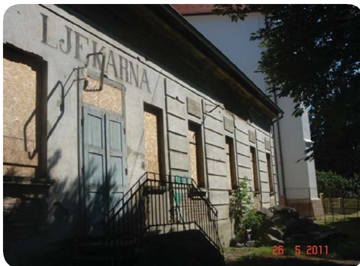
Stara/prvotna ljekarna, nalazila se najprije u samostanu, potom je podignuta kao samostalna zgrada ispred samostanskog zapadnog zida na ogradi toga zida

U 13. st. naselje je dobilo status slobodnog trgovišta (oppidum Ivanich), što je 1405. potvrdio kralj Žigmund Luksemburški. Zagrebački biskup Luka Baretin podignuo je početkom 16. st. crkvu Sv. Ivana Krstitelja i uz nju novi samostan, u koji su se 1508. uselili franjevci. Godine 1549. samostan je napušten zbog osmanlijske prijetnje, a povratkom franjevaca 1639. ponovno je obnovljen. Do 1703. naselje je bilo u sastavu Vojne krajine, isprva pod kraljevom upravom, potom pod upravom hrvatskog bana.