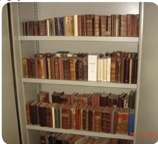
Trezor sa starim i rijetkim knjigama

Knjižnica ima tri inkunabule iz 15. stoljeća te 34 primjerka knjiga iz 16. stoljeća. Knjige su tiskane u Italiji, Austriji, Njemačkoj, Francuskoj i Češkoj (današnje zemlje), te su tiskana na jezicima pojedinih naroda, pa tako ima na našem hrvatskom jeziku glagoljskim slovima. 11