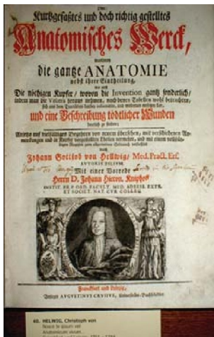
Stranica knjige Hellwig von Christophora

“Directorium anti pestilentiale, oder: Kurtze ohnmassge-bliche Pestordnung....”