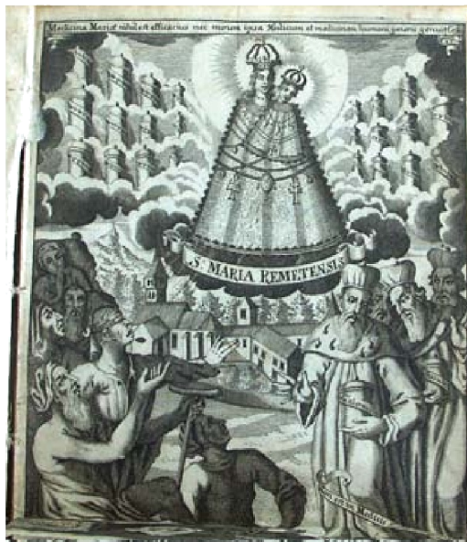
Naslovna stranica "Slavna ljekaruša ..."

U knjižnici među medicinskim knjigama našla se i knjiga: