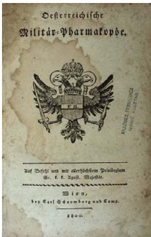
Naslovna stranica vojne pharmacopoeae

Autor svojim mišljenjem i zapažanjima D. Fridrich Hoffmanna, objašnjava sadržaje pharmacopoeae kroz nekoliko godina u 6 knjiga, uz to donosi i propisane takse za lakši rad ljekarnika.