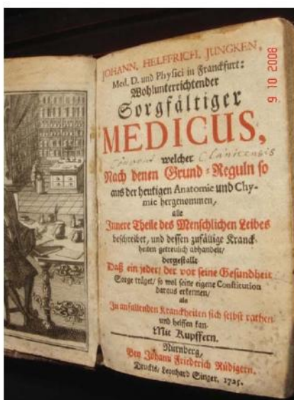
Naslovna stranica knjige J. H. Jungken, foto: B.T., 2008.

Najveći broj svojih knjiga imao je SCHROFF fra BALTAZAR: Georgius Golman , Chirurgiae tripartita flora, 1680. Johanes van Horne , Klcinc Kunst oder Kurze Anleitung zur Wund-Artzney, 1679.