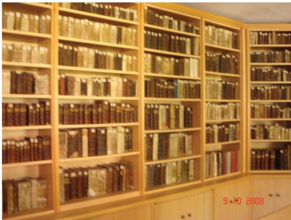
Unutrašnjost knjižnice, foto: B.T., 2008.

Da su samostanska braća ranarnici i ljekarnici imali prikladno medicinsko i ljekarničko znanje svjedoči bogati knjižni fond iz područja medicine - 67 stručnih medicinskih knjiga. Knjižnica je prilikom boravka (2008.) bila složena u dvije prostorijske s izloženim najvrednijim crkvenim primjercima, ali nije bila sređena kartoteka. 20