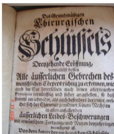
Naslovna stranica knjige F. B. v. Lidern, 2008.

Christof Glaser . Chimischer Wegweiser d. i. sichere Anweisung zur chimisehen Kunst, darinnen durch einen kurtzen Weg und leichte Handgriffe gewiesen wird, wie man allerleyen Artzneyen durch die Chimie bereiten Kann, izdano u Jeni 1677. - prijevod s francuskog,